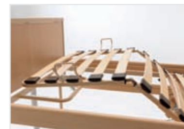
Dodatna nastavev nožnega dela z Rastatom (možna tudi naknadna montaža)