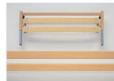
Podaljšek postelje (možna tudi naknadna montaža)