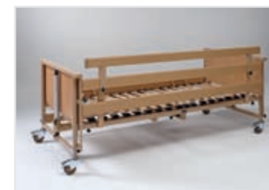
Dodatna povišica stranskih varnostnih ograj