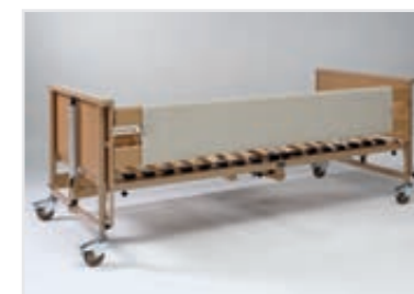
Usnjena stranska zaščita