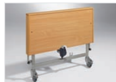
Lesena pokrivna končnica (možna tudi naknadna montaža)

Servirna obposteljna ali prekoposteljna mizica (ni slike)