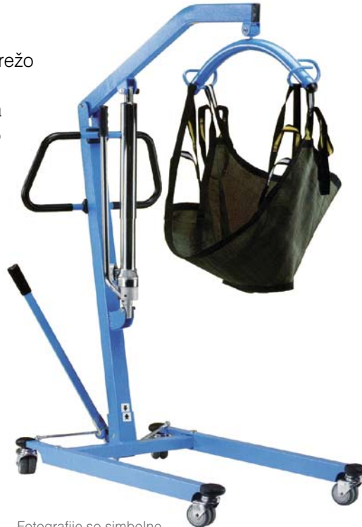
Fotografije so simbolne