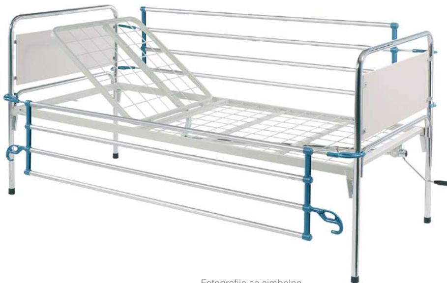
Fotografije so simbolne