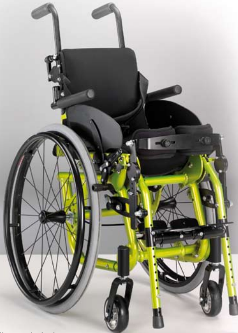
Fotografije so simbolne