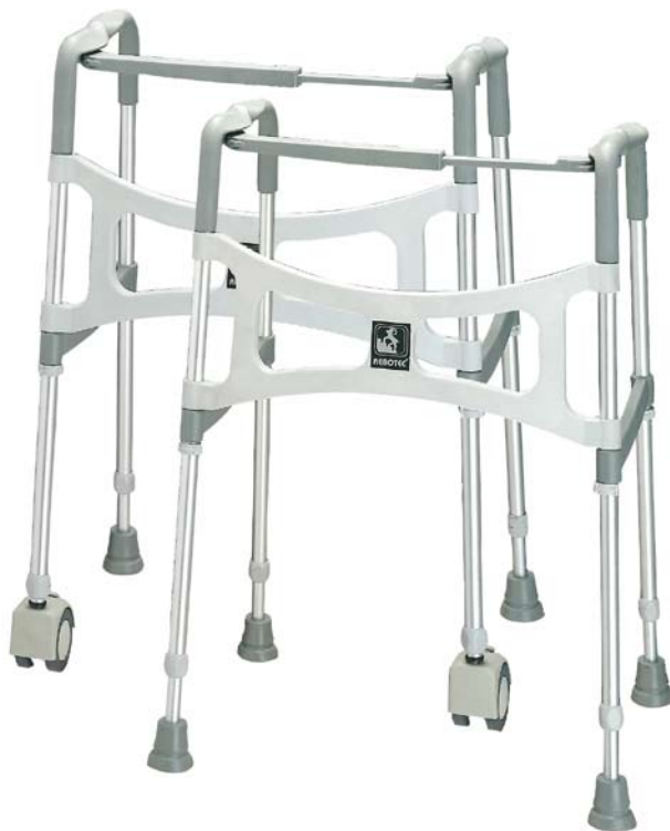
Fotografije so simbolne